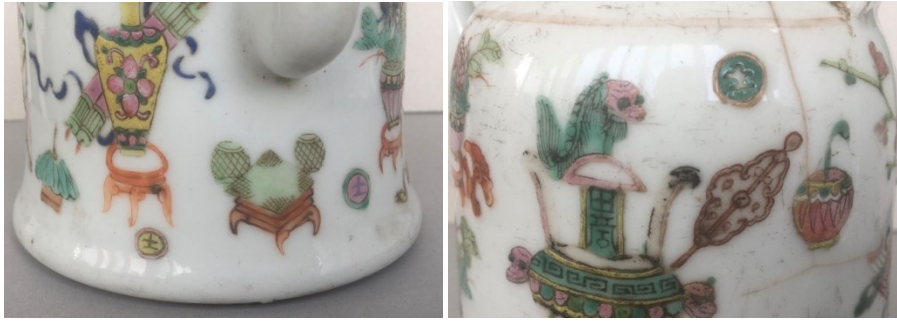
光绪粉彩博古象棋壶之局部二图