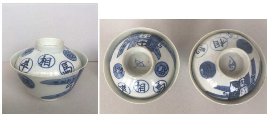
清中期青花象棋八破图茶杯侧视图及俯视图

八破纹的题材主要是金石碎牒的拓片、旧书散页，书画字简残片组合后叠成的画面。最初象棋仅仅是作为旧谱散页，零落棋子中一个配角形象出现。棋子本身有文字，又有零散，易被废弃的特点，在清末民初竟一跃成了陶瓷八破图的主角。有一路陶瓷八破图竟出现了全以象棋为主的情形——除了各种棋子就是棋谱——不见其他器物。已是喧宾夺主之势。如下图