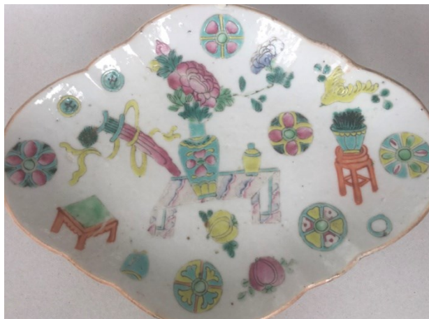
同治粉彩皮球花象棋纹海棠贡盘

图案中两只‘士’引人注目，其实不必寻找其寓意，‘士’棋子的存在本身就显得美好和文雅，