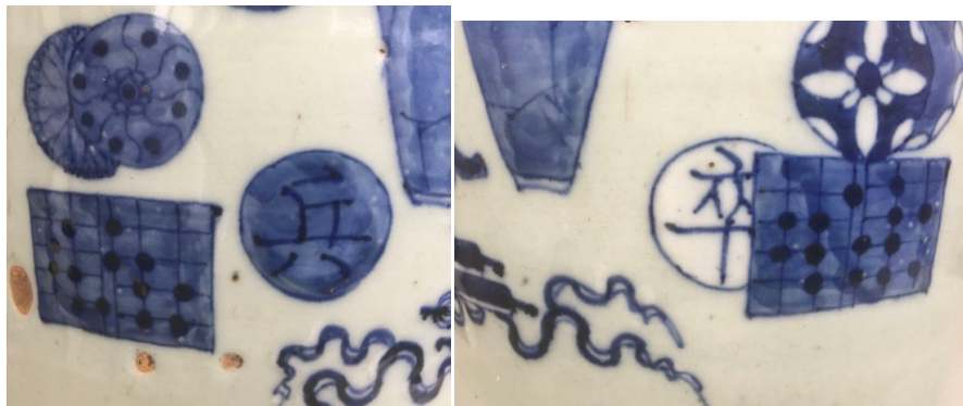
清中期青花盘口瓶局部图

美好寓意，是清代传统吉祥纹饰之一，自然本不足奇。可是我们发现作者别出新意地在大瓶的下角配置了‘兵’‘卒’各一只和两副棋盘。似乎是对‘平升三级’的条件作出暗示：即如要‘平升三级’先要‘身先士卒’还需‘胸怀全局’{用棋盘暗示}，见下边局部之图示。用兵卒这双象棋中最小子力，表达要从底层开始，从无名小卒出发，卧薪尝胆发奋努力的务实精神。给人们以教育和启发，不但三观正确而且寓意恰如其分，是一则象棋纹饰表达喻世教育的范例。从陶瓷艺术来看其青花发色明亮又不失淡雅，器物古拙之气充盈，排列疏密得当，主体鲜明，与清末作品风格迥异。