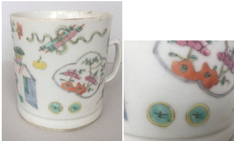
清同粉彩治博古茶杯侧面图及局部图

博古纹饰在清康熙朝时开始盛行，官窑、民窑、外销瓷上均出现博古纹饰的五彩、青花五彩瓷器物等。其纹饰多体现在民窑器物之上，官窑器物较少。光绪朝博古总体上图案繁多，画面满，多通景少开光，且多富有民间趣味。博古纹中出现大量的象棋子图案从清中早期开始在同治、光绪年间突然大量增加，是这种民间趣味的先声。除了博古还有一种近似的清供、多宝纹题材上，也出现象棋子的装饰因素，情形与博古纹差不多就不独立分类了。象棋图案引入博古纹后大大丰富了博古纹饰的内涵和受众群体。