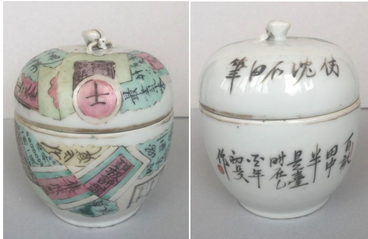
清光绪粉彩八破象棋温酒器