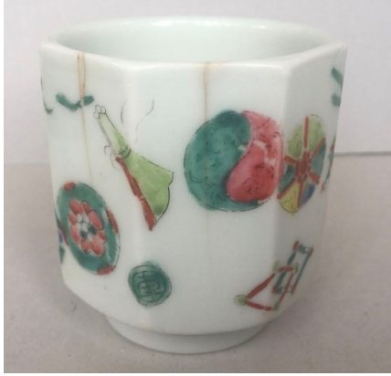
右图为光绪皮球花八棱茶杯

皮球花纹较小，排列自由活泼，不苛求均衡，皮球花在清代雍正官窑瓷器上开始普遍应用，且多出现于粉彩瓷器上；与此同时，宫廷漆器、家具及服饰等诸多类别中，都能见到以皮球花作为主题的装饰。清早期开始景德镇民窑就开始大量烧造此类瓷器，清末有的瓷器则添加了棋子，棋子本身是圆形，与皮球花搭配和谐、自然。棋子上必有文字，给人一种文雅清新之感。受到了消费者的喜爱。当然以存世数量而言在四种象棋纹饰中最为稀少。